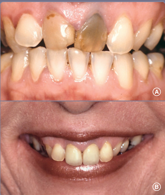
A: Misfarvede tænder før kronebehandling.